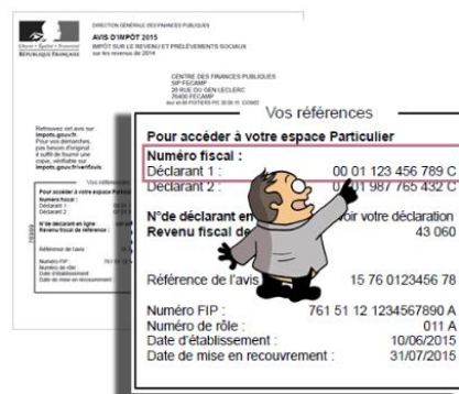
Figure 6 : numéro fiscal sur l'avis d'imposition.