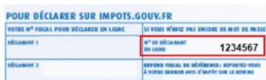
Figure 7 : numéro de télé-déclarant sur la déclaration de revenus.