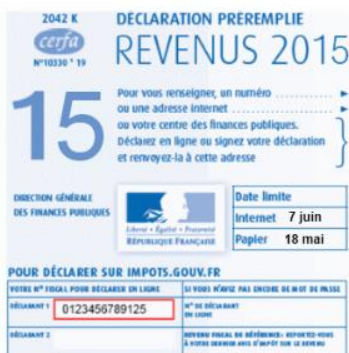
Figure 5 : numéro fiscal sur la déclaration de revenus.